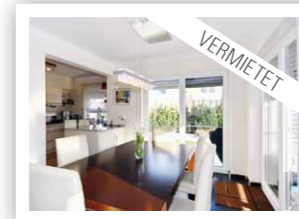
HOCHWERTIGE TERRASSENWOHNUNG: Wolfsburg, 206 qm, 140 qm Garten, 6 Zimmer, mit moderner EBK und Carport