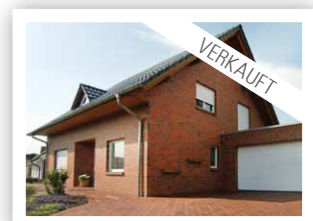
WOHNGALERIE ZUM VERLIEBEN: Wolfsburg, Bj. 2000, 5 Zimmer, 170 qm Wohnfläche, 751 qm Grundstück