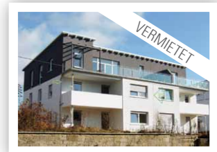
NEUBAU-TRAUMWOHNUNG: Wolfenbüttel Teichgarten, 3 Zimmer, 103 qm Wohnfläche, sonniger Balkon