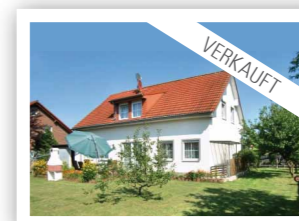
FREISTEHENDES EINFAMILIENHAUS: Wolfenbüttel, Baujahr 1998, 165 qm Wohnfläche, 575 qm Grundstück

„...Inzwischen ist mir auch von anderer Seite mehrfach bestätigt worden, dass Sie mein Objekt prima dargestellt und angeboten haben. Die Offenheit und Professionalität spricht ohne wenn und aber für Sie...“ Familie F. aus Freiburg