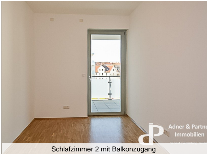
Schlafzimmer 2 mit Balkonzugang