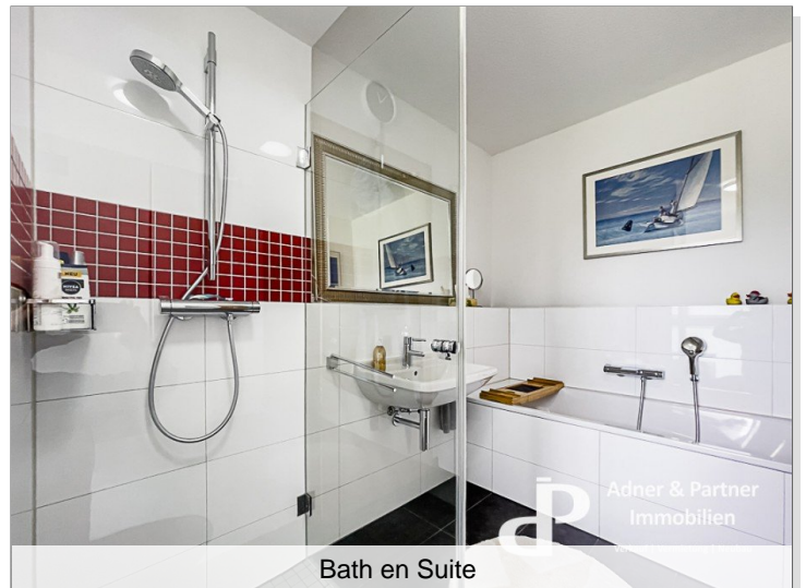
Bath en Suite