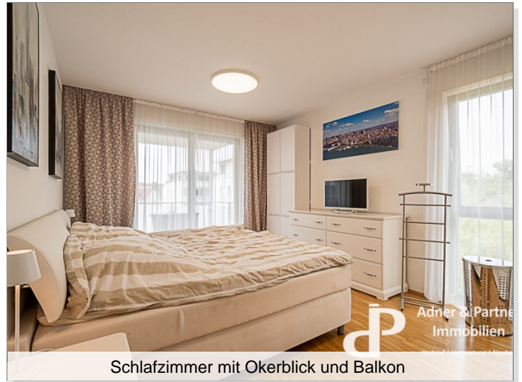
Schlafzimmer mit Okerblick und Balkon