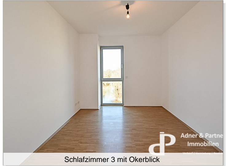
Schlafzimmer 3 mit Okerblick